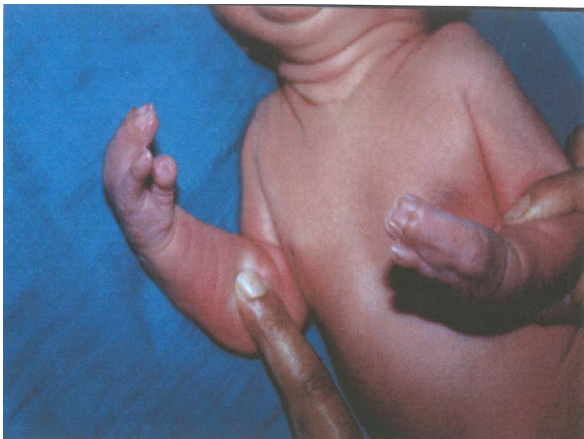
Syndactylie des mains d'origine génétique comportant des fusions ostéo-articulaires