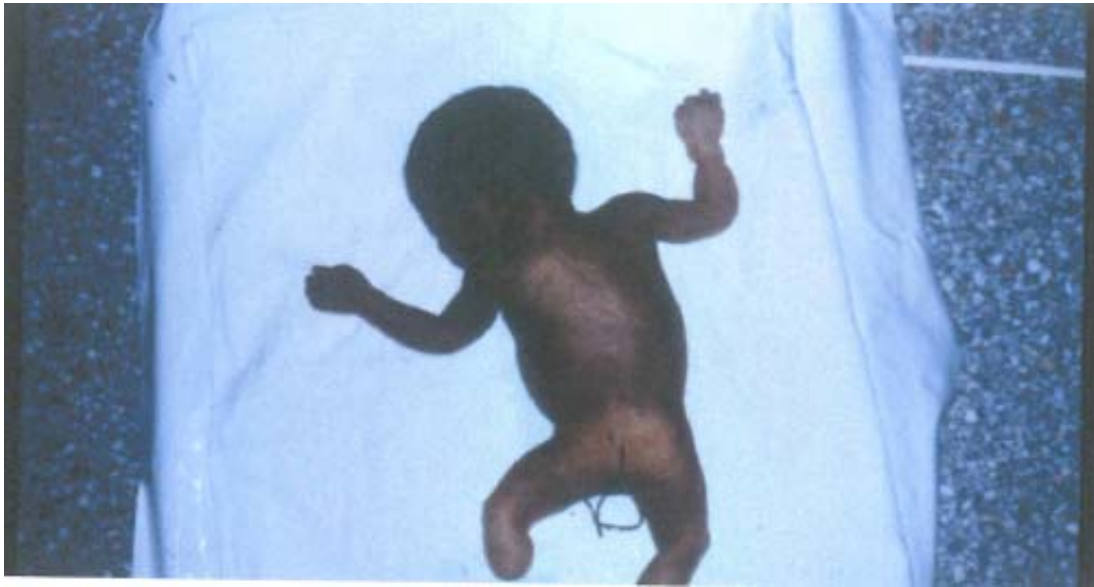
La même enfant vue de dos. A noter aussi le sillon de constriction au niveau de l'avant-bras droit.