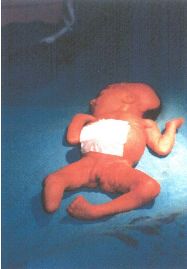
La petite fille A avec amputation de la jambe droite, pied bot gauche, syndactylie des doigts et des orteils gauches.