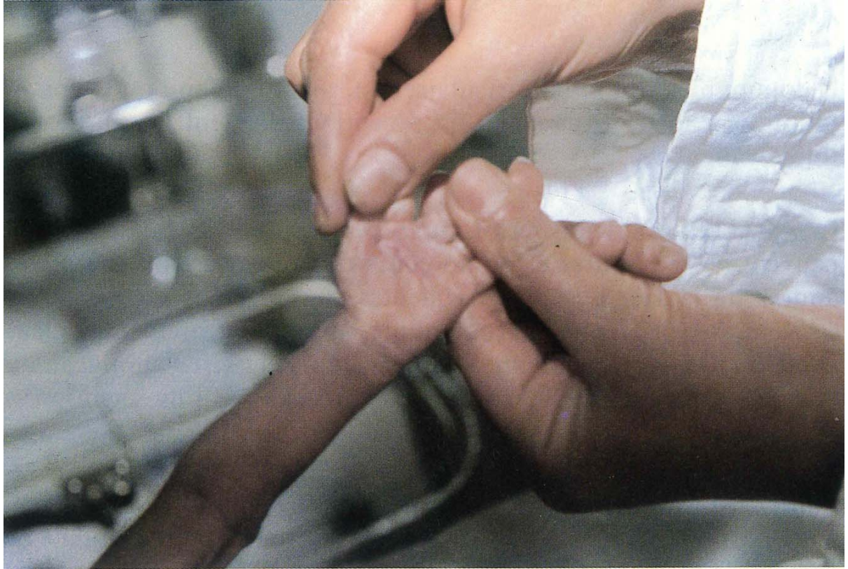
* Anomalies du dermatoglyphe