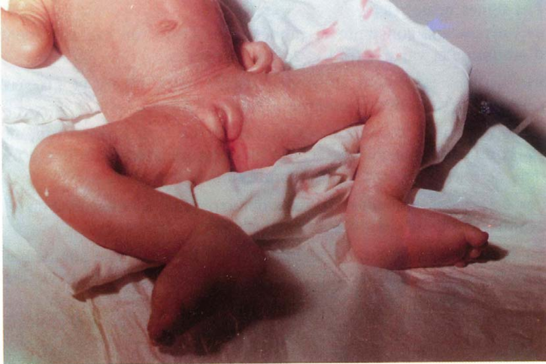
* Oedèmes des membres inférieurs en rapport avec une GNA post-streptococcique affectant une fillette âgée de 21 mois.